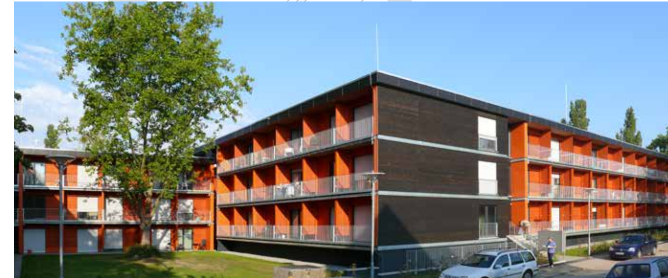
Die Wohnanlage „Eastsite“ liegt in unmittelbarer Nachbarschaft zu den Universitäts-Sportstätten am Luisenpark im attraktiven, grünen Stadtteil Neuostheim.