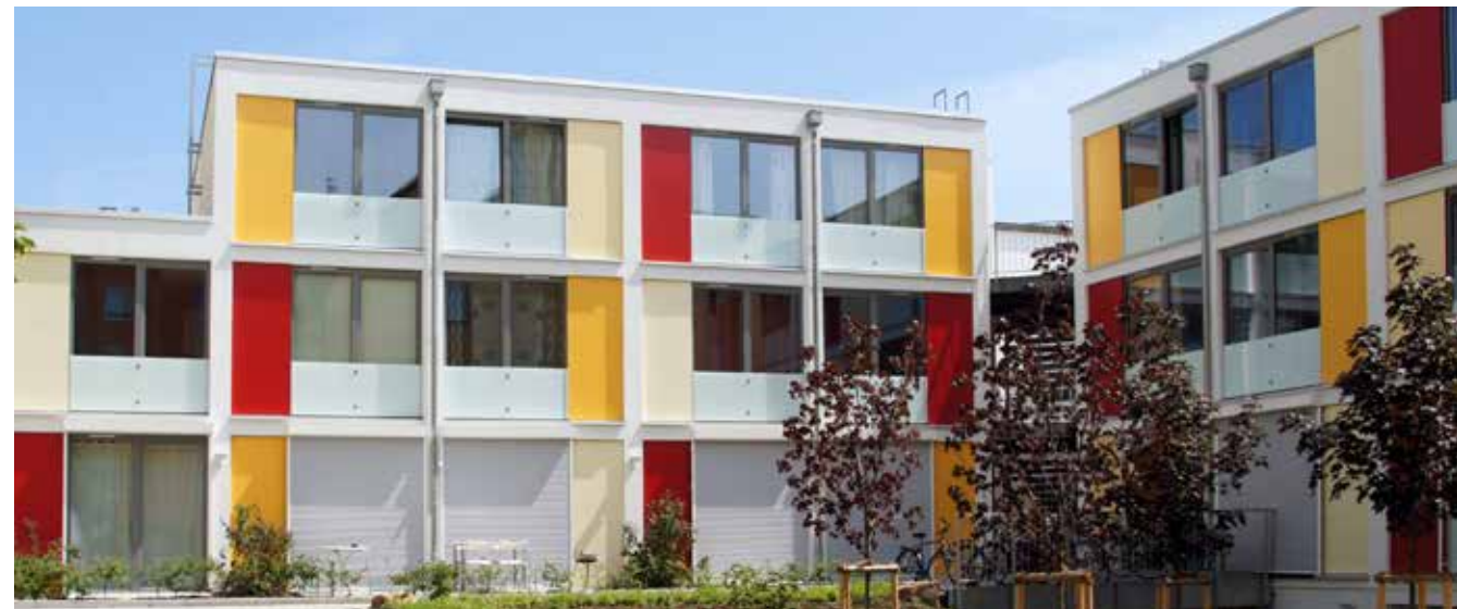
Stylisch und komfortabel: Die Apartments in der Wohnanlage B 7.