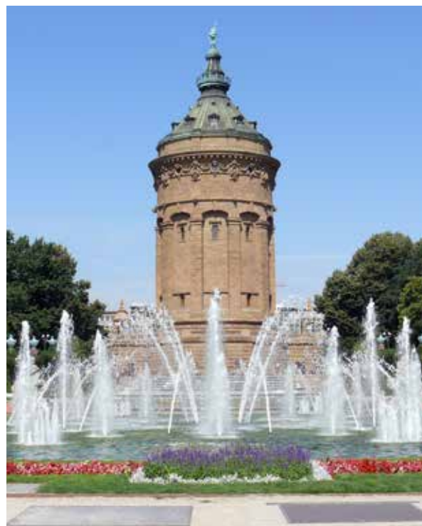
Berühmtes Wahrzeichen: Der Friedrichsplatz rund um den Mannheimer Wasserturm ist beliebter Treffpunkt in der Innenstadt.

Mannheim (kurpfälzisch: Mannem [ manem ]) ist das lebendige Zentrum der Metropolregion Rhein-Neckar, eine der wirtschaftsstärksten Regionen in Europa. Gleichzeitig gilt die über 400 Jahre alte Quadrate- und Universitätsstadt als Deutschlands Hauptstadt des Pop mit einem riesigen Kulturangebot, als großstädtische Einkaufsmetropole sowie als Standort exzellenter Hochschulen. Studierende finden im multikulturell geprägten Mannheim den idealen Nährboden für die Entwicklung von Persönlichkeit und beruflichem Know how.