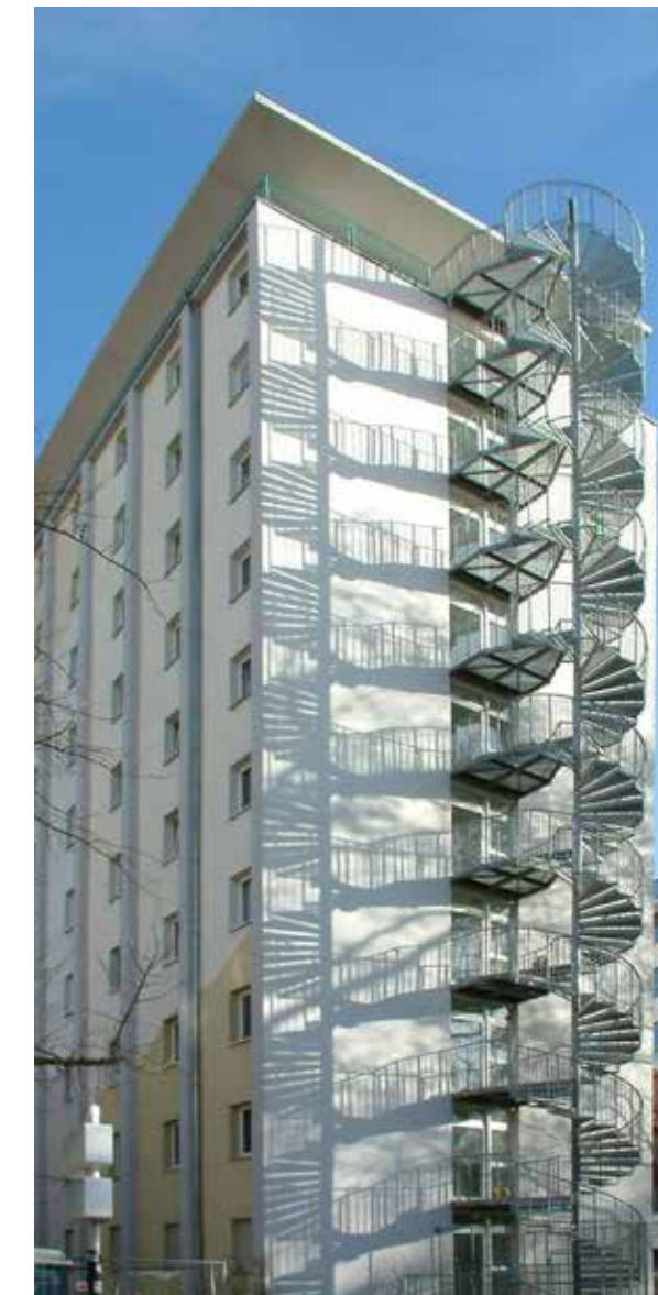
Hoch hinaus – im Herzen der Stadt, Studentenwohnhaus N 6, 8.

Mit den hilfreichen Grundrissen, die du auf der Homepage des Studierendenwerks zu jedem Wohnhaus abrufen kannst, ist schon vor dem Einzug der Platz für den Lieblingssessel schnell gefunden.